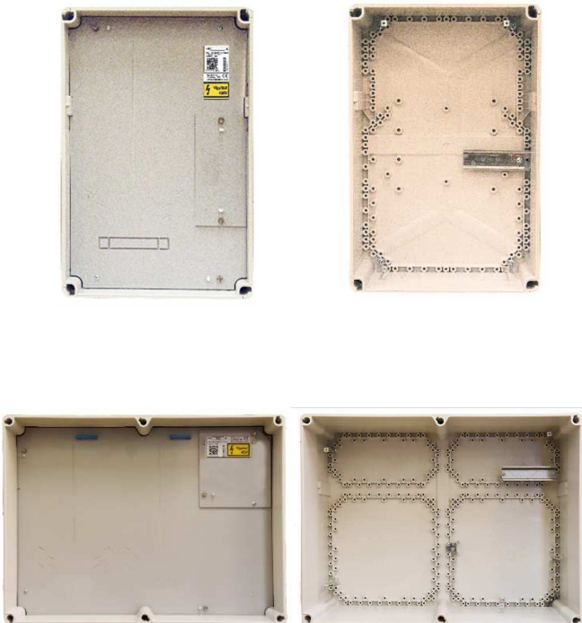
JÓ MINŐSÉGŰ FÉNYKÉP A BELSŐ TÉRRÉSZRŐL (mérő, vezérlő, sorozatkapocs, kismegszakító felszerelhetősége):