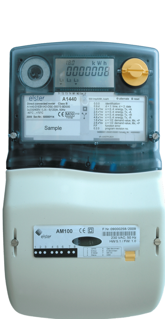
Elektronikus háromfázisú fogyasztásmérő alpha AS1440